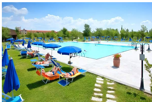
La piscina per i momenti di "libertà"