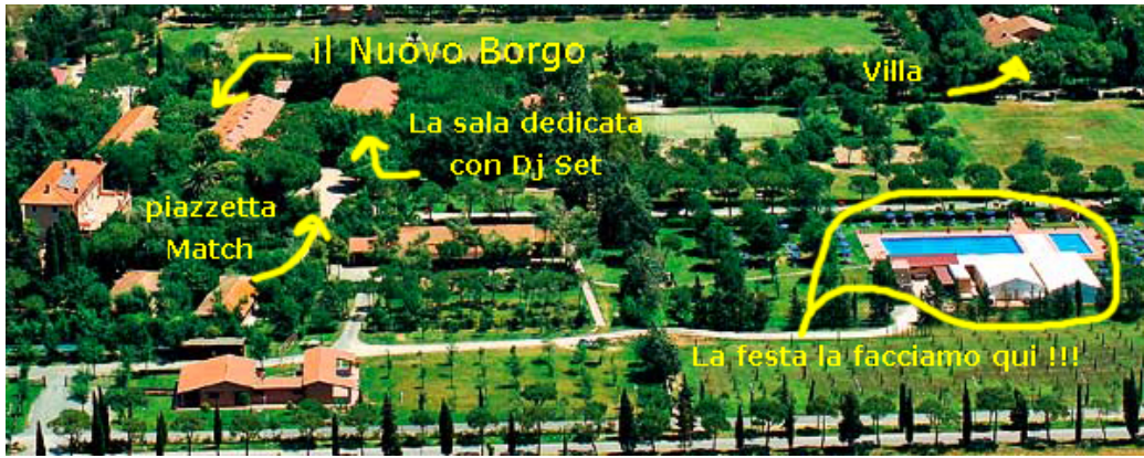
Vista aerea della zona riservata al raduno...