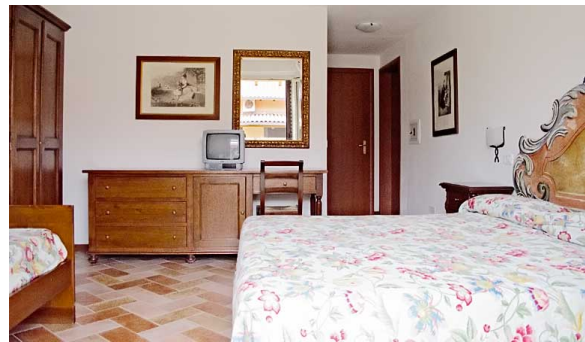
Esempio di camera tripla in appartamento