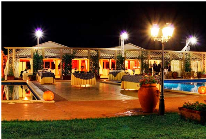
Festa a bordo piscina con la BANDABARDO'