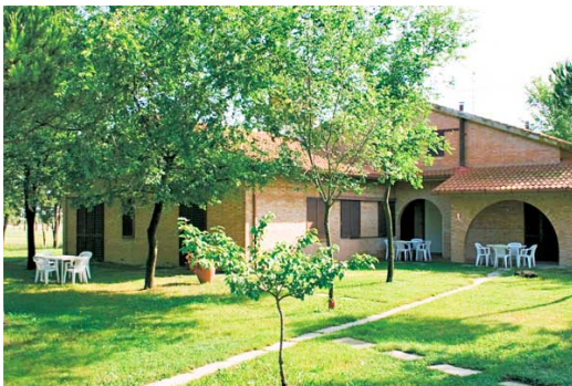
Un esempio degli appartamenti nelle "ville"